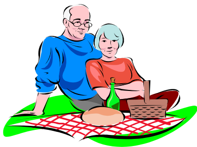
乾癬とくらすの ホームページ画像

のぶたん&300字の世界へようこそ 昨年末に開設された、ホームページです 「乾癬」短歌「暮らし」仕事「家族」